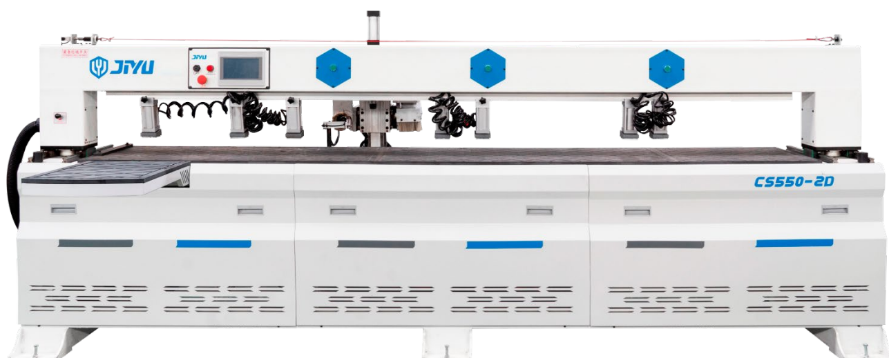
Торцевой сверлильно-присадочный станок с ЧПУ CS-550-2D